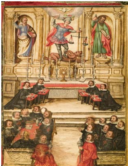
1670ko Gasteizko kontzejuko karguen Juramenduen Liburuko irudia. AMVG 8-22.

Azkenean, urte hartako uztailaren 6an Biltzar Nagusi bat egiteko deialdia egin zen eta Errege Pragmatikaren arabera jokatzera erabaki zen. Hori dela eta, diputatu berriak urtebetez mantenduko luke diputatu nagusi kargua, “hurrengo Santa Katalina egunera arte” , hain zuzen, eta ordutik aurrera karguaren iraupena bi urtekoa izango zen.