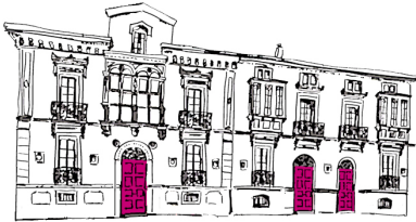
Arabako Batzar Nagusiak Juntas Generales de Álava