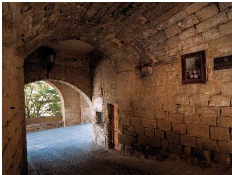
Labraza. 1196. urtean sortutako hiribildua.