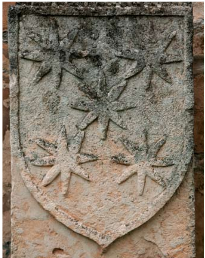
Burgoseko Rojakoen leinukoa izan daitekeen armarrria. Familia hori Araban izan ziren XIV. mendetik aurrera. Mendozako Heraldika Museoa (Araba).