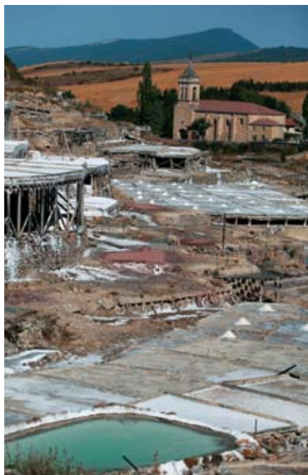
Gesaltza-Anaña. 1140. urtean sortutako hiribildua.