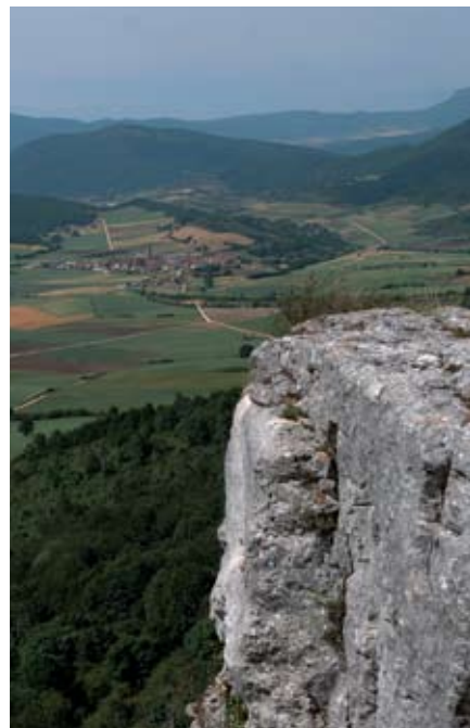
Done Bikendi Harana. 1312-1319 artean sortutako hiribildua.