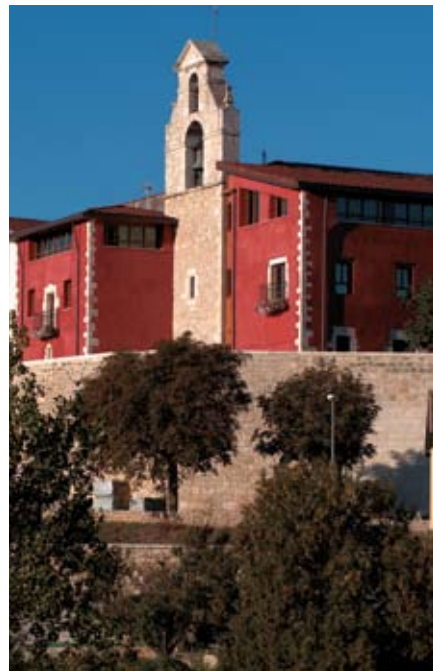
Agurain. 1256. urtean sortutako hiribildua.