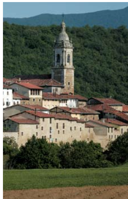
Antoñana. 1182. urtean sortutako hiribildua.