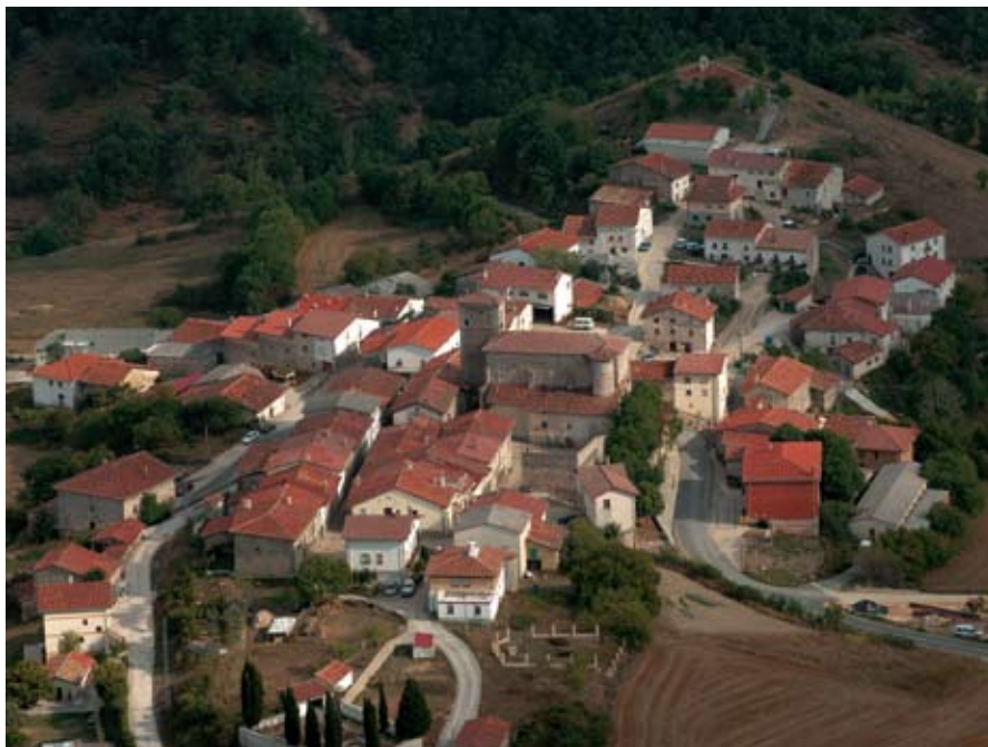
Kontrasta. 1256. urtean sortutako hiribildua.