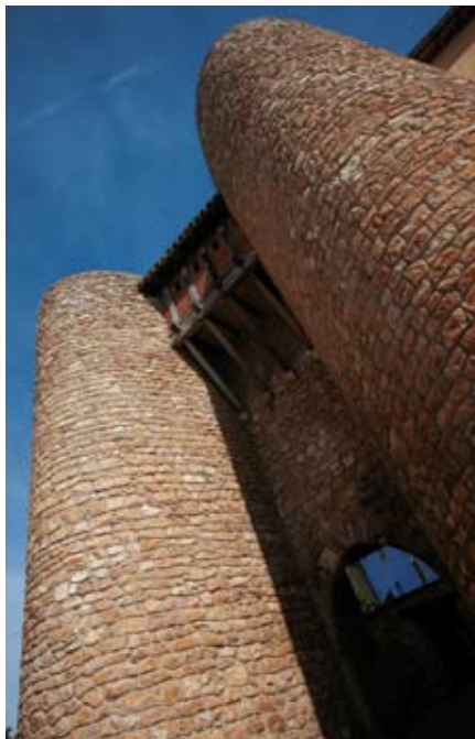
Urizaharra. 1256. urtean sortutako hiribildua ? Foto Quintas.