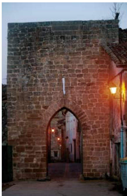
Bernedo. 1182. urtean sortutako hiribildua.