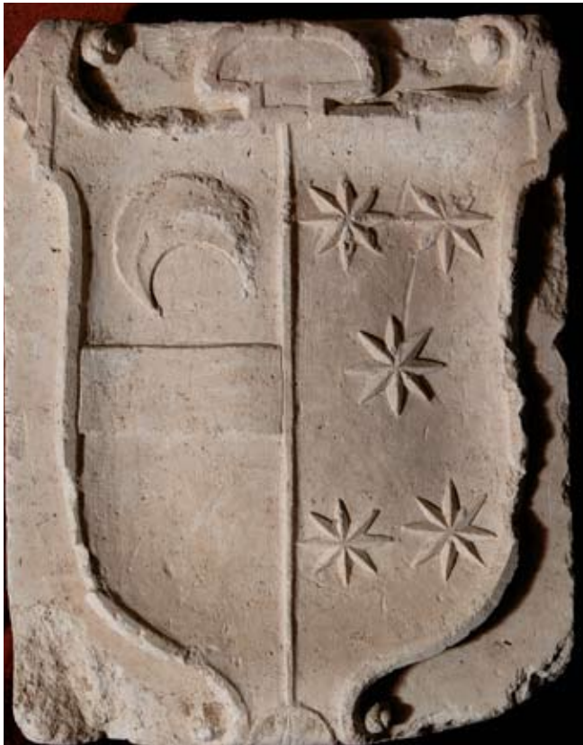
Infantearen lurraldeko V. Dukearen hilobia apaindu omen zuen armarrria. Duke hori 1601. urtean hil zen. Mendozako famili horren Kaperañ izan zuten armarrri hori. Mendozako Heraldika Museoa (Araba).