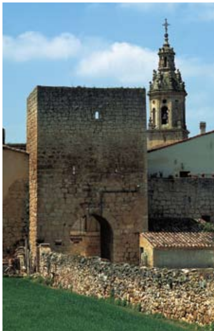
Salinillas Buradón. 1264. urtea baino lehen sortutako hiribildua.