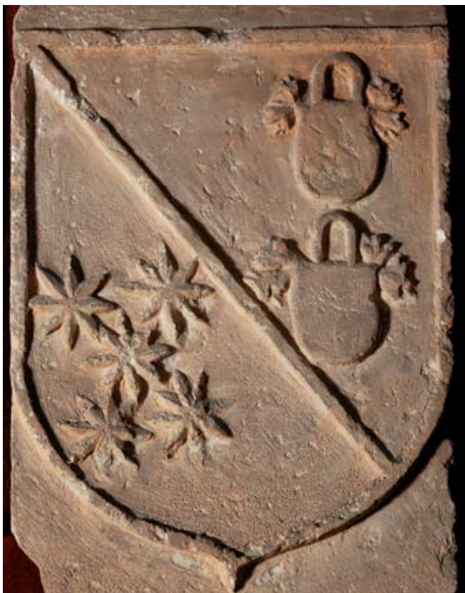
Basabeko Dorretik ekarritako armarrria. Rojas eta Gaona familiena da. Mendozako Heraldika Museoa (Araba).