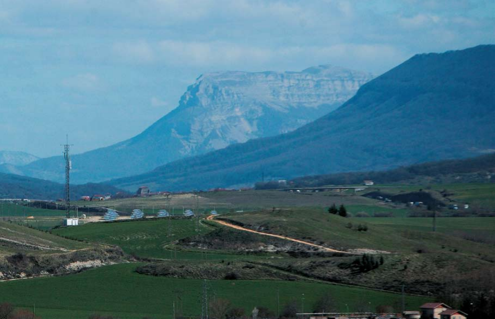
Aralar eta Urbasa Mendizerren arteko muga honetan gertatu ziren Jaun eta Errege eta gaizkileen arteko borroak. Borroka honien ondorioz batez ere erabaki zuten Arabako Ermandade Nagusia sortzea.

asilo-eskubidea kendu zieten gaizkileei babesa emateagatik, adibidez Alfaro Gaztelan eta Corella Nafarroan.