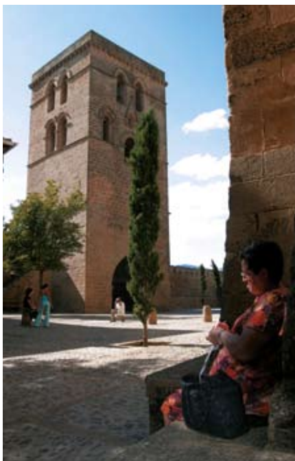
Guardia. 1164. urtean sortutako hiribildua.