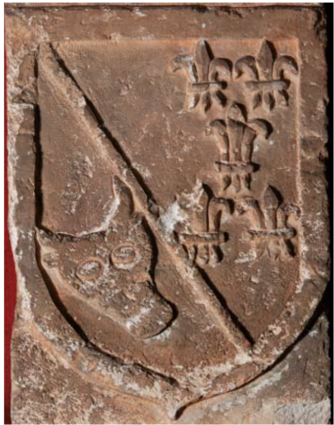
Basabe Dorretik ekarritako armarrria. García de Arce eta Cabeza de Vaca familiena da (Dorreaken Jauna). Mendozako Heraldika Museoa (Araba).